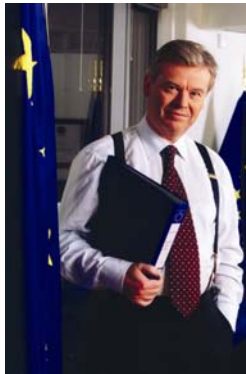
David Byrne EU Kommissar für Gesundheits- und Verbraucherschutz